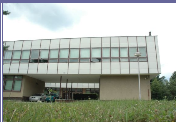
Budova Archivu v Kaničích u Brna.