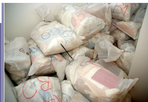
ABS převzal také 468 pytlů dokumentů VKR.