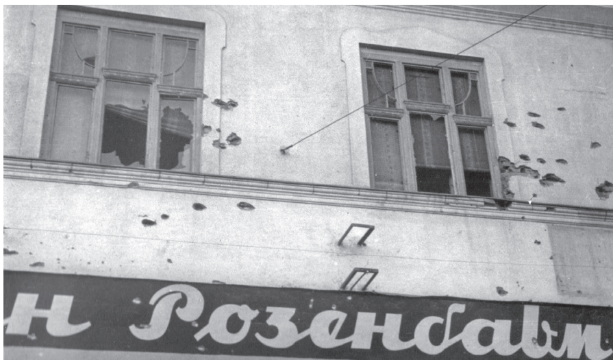
Fasáda domu obchodníka Rosenbauma v Chustu poškozená při bojích ráno 14. března 1939