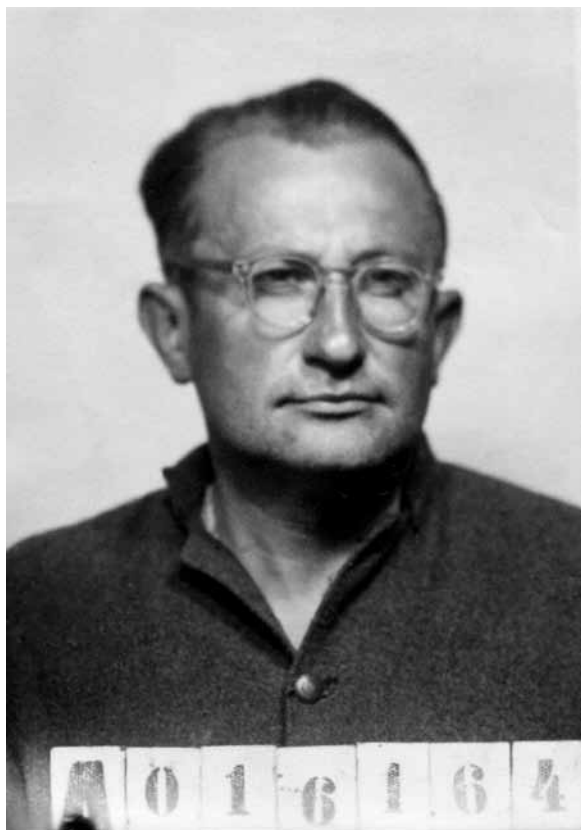
Fotografie z vězeňského spisu