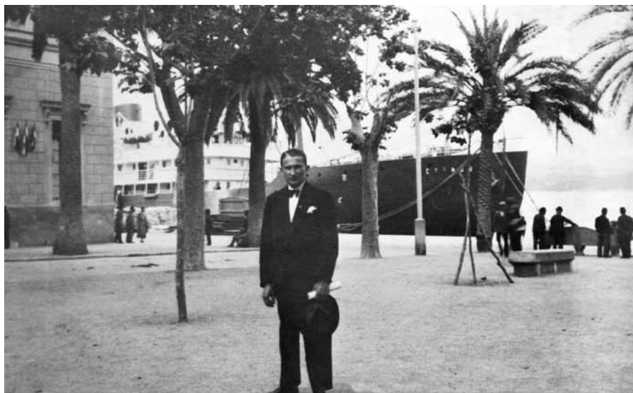
Cesta do neznáma – leďčický rodák se v roce 1930 vydal na zkušenou do Francie, odkud se vypravil na Korsiku a posléze zamířil do africké Casablancy