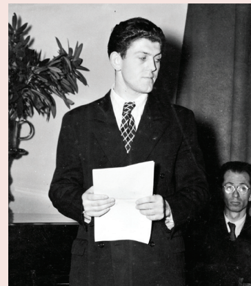
V Londýně na konci 40. let