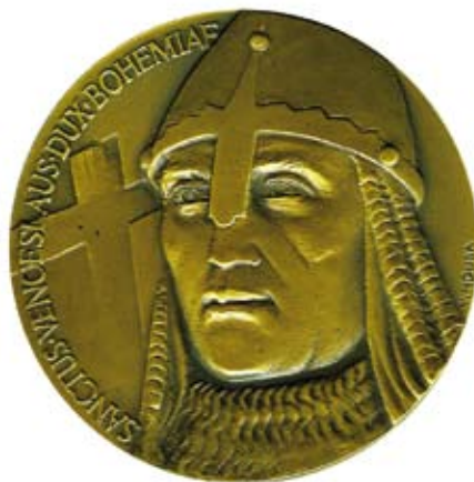
Svatováclavská medaile