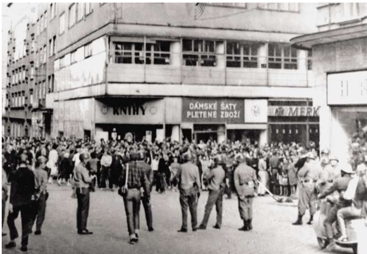
Kordon příslušníků LM před demonstranty na rohu Masarykovy ulice a náměstí 25. února (dnes Zelný trh), 21. srpen 1969

hromadně opouštělo stadion, takže místo původních asi 9000 návštěvníků zůstalo na velodromu asi 500 osob, z nichž část se dopustila nových provokací, pískání při sovětské hymně, urážlivé výkřiky apod. 10 Tentokrát bezpečnostní orgány zajistily a předvedly k výsledku 20 osob. Ve všech zaznamenaných případech vyjadřovali zadržení občané různými způsoby protest proti závodníkům ze Sovětského svazu. 11