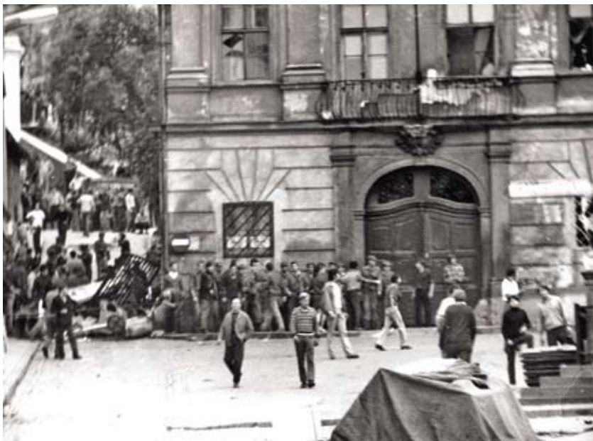
Improvizovaná barikáda na začátku Petrské ulice (ústíčí na náměstí 25. února) mezi Dietrichsteinským palácem a Domem pánů z Fanalu, 21. srpen 1969

Pro posílení zásahových složek VB a LM byly mobilizovány také všechny dosažitelné armádní jednotky. Vedení Vojenské akademie Antonína Zápotockého (VAAZ) zorganizovalo dva hotovostní prapory (každý o dvou rotách) v celkovém počtu 200 vojáků z výcvikové brigády, včetně později nasazené jednotky obrněných transportérů z 1. (velitelsko-organizační) fakulty ve Vyškově. Pro zásah v ulicích byli určeni příslušníci vojenských útvarů (VÚ) 7357, 864 a 1852 z Brna, kromě nich se ještě v záloze nacházela „hotovostní jednotka Kaktus“, složená z příslušníků VÚ 4428 (Hodonín), VÚ 3866 (Mikulov) a VÚ 8525 (Uherské Hradiště) – tato jednotka byla ovšem nasazena až ve 21 hodin. 25 Z rozkazu ministra obrany ČSSR arm. gen. Martina Dzúra začal také přesun dvou pluků 4. tankové divize, která se ve večerních hodinách 21. srpna soustředila v blízkosti Brna. 26