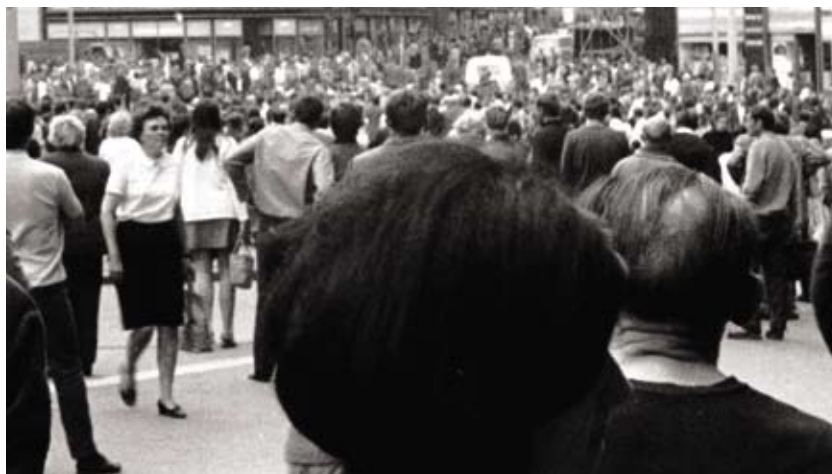
Dav demonstrantů na náměstí Svobody, 21. srpen 1969

Nastal osudný čtvrtek 21. srpna 1969. V souladu s nařízením operačního štábu KS SNB měly všechny útvary bezpečnostních složek plnou pohotovost a do ulic byly ve zvýšeném počtu nasazeny hlídky. Již v 5.35 hod. vybuchl dělbuch na Masarykově ulici 15 a následně příslušníci VB poblíž zadrželi čtyři mladíky. V prvních ranních informačních svodkách o situaci v Brně se objevilo hlášení o neznámém řidiči vozidla Škoda MB 1000, který rozhazoval letáky. Ty se objevily také na konečné zastávce tramvaje v Brně-Řečkovících. Na domě na Palackého ulici č. 26 v Brně-Králově Poli byl objeven nápis Husák je svině! a dále na Veslařské ulici v Brně-Pisárkách Okupace 21. 8. 1968 s přimalovanou pěticípou hvězdou a hákovým křížem. Šlo