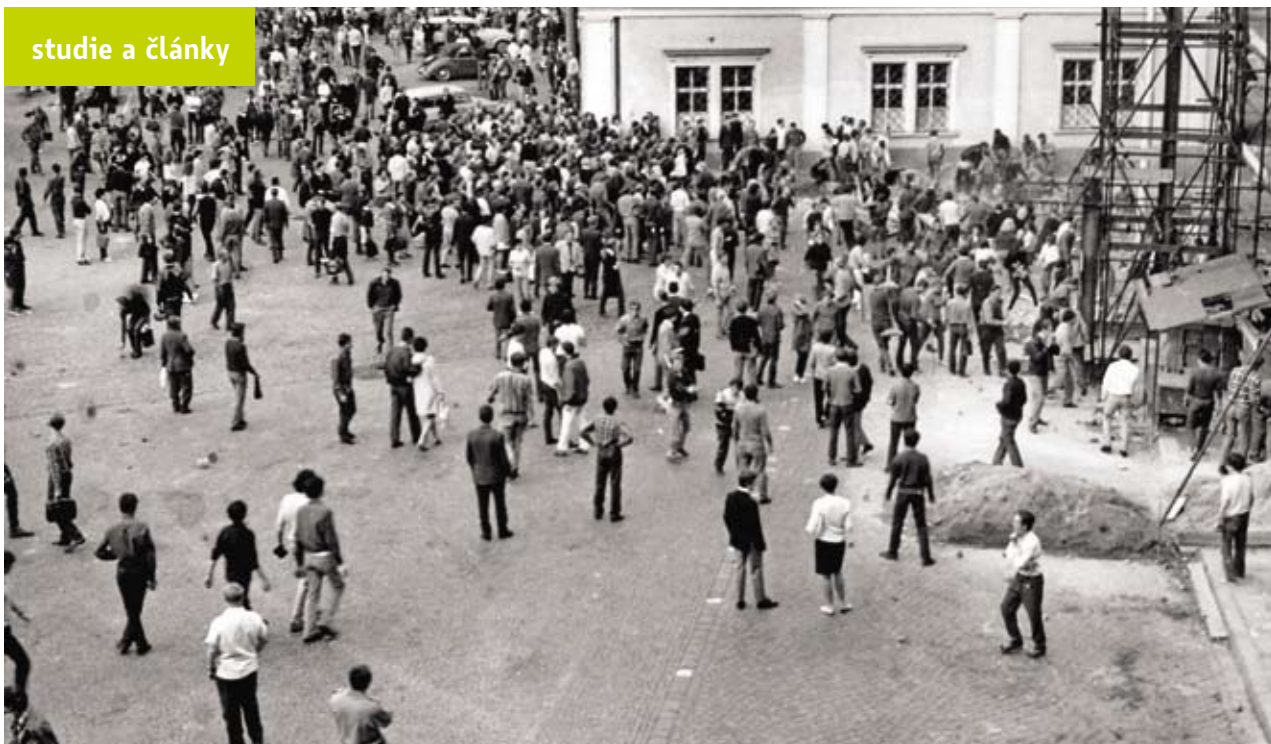
Dav demonstrujících občanů na náměstí 25. února a stavění improvizované barikády v úzkém prostoru vedoucím na Kapucínské náměstí, 21. srpen 1969