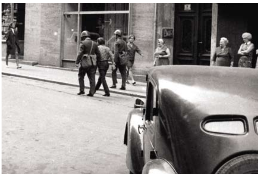
Příslušníci LM (u milicionáře vlevo je patrný samopal vz. 61 Škorpion v pouzdru vedle ochranné masky) vedou zatčeného demonstranta po Orlí ulici.