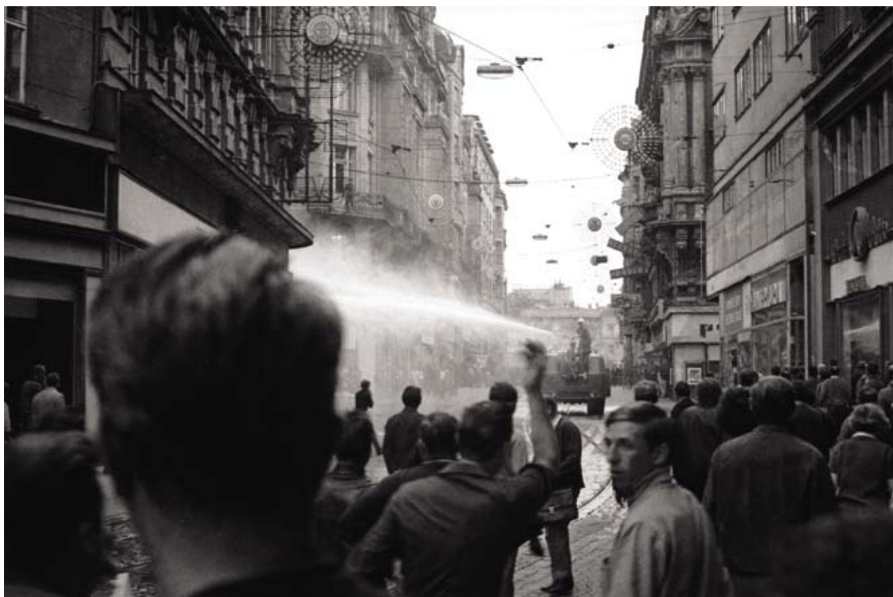
Vodní dělo na Masarykově ulici při zásahu proti demonstrantům směrem na náměstí 25. února, 21. srpen 1969