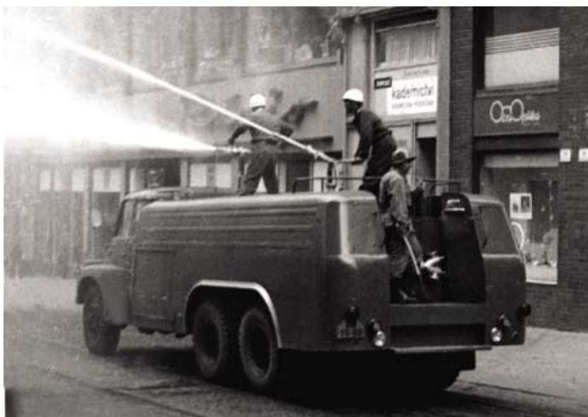
Zasahující vodní dělo na rohu Masarykovy a Květinářské ulice, 21. srpen 1969

Krátce po poledni přijela do centra města první vozidla „těžké“ techniky – vodní dělo, cisterna s vodou, dva vrhače slzotvorných granátů a šest nákladních vozů s pískem spolu s dalšími 80 příslušníky SNB. Pasáž Beta