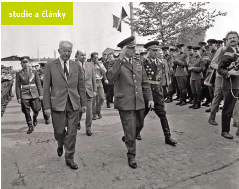
Dne 7. května 1969 navštívil prezident ČSSR Ludvík Svoboda a první tajemník ÚV KSČ Gustáv Husák a další představitelé střední skupiny sovětských vojsk „dočasně“ dislokovanou na území Československa