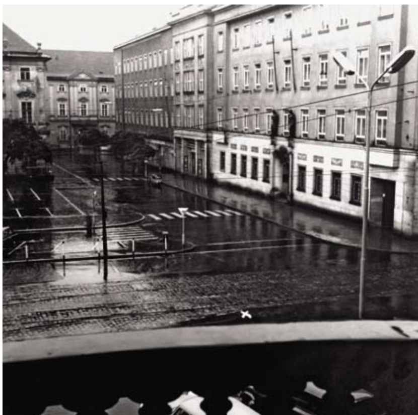
Fotografie z vyšetřovacího spisu Danuše Muzikářové – pohled na místo činu (označené křížkem) z balkonu budovy tehdejšího Okresního národního výboru Brno-venkov na náměstí Rudé armády