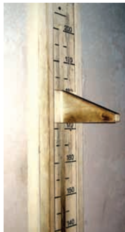
Ve skutečnosti popravčí zařízení, tzv. Genickschuss