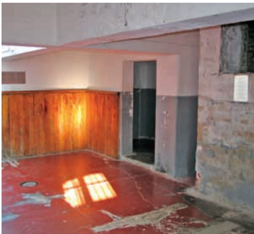
Tzv. ordinace – popravčí místnost