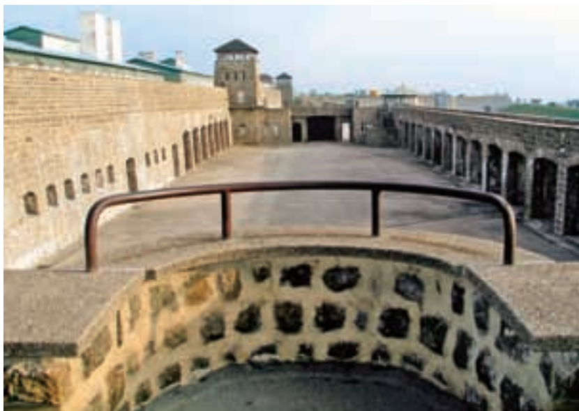
Vyhlažovací tábor Mauthausen