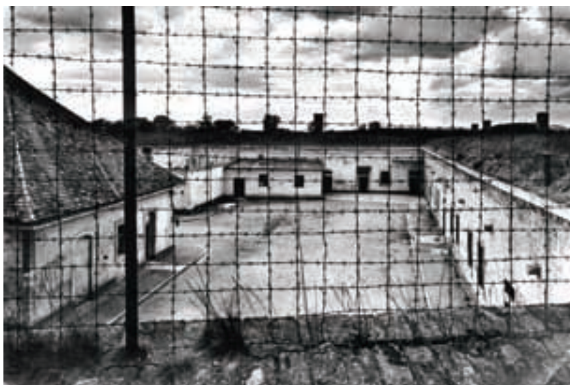
Malá pevnost Terezín, věznice pražského gestapa

Ráno bylo hlučnější. Co s nimi běsnící Němci zamýšlejí, se „Parašutisté“