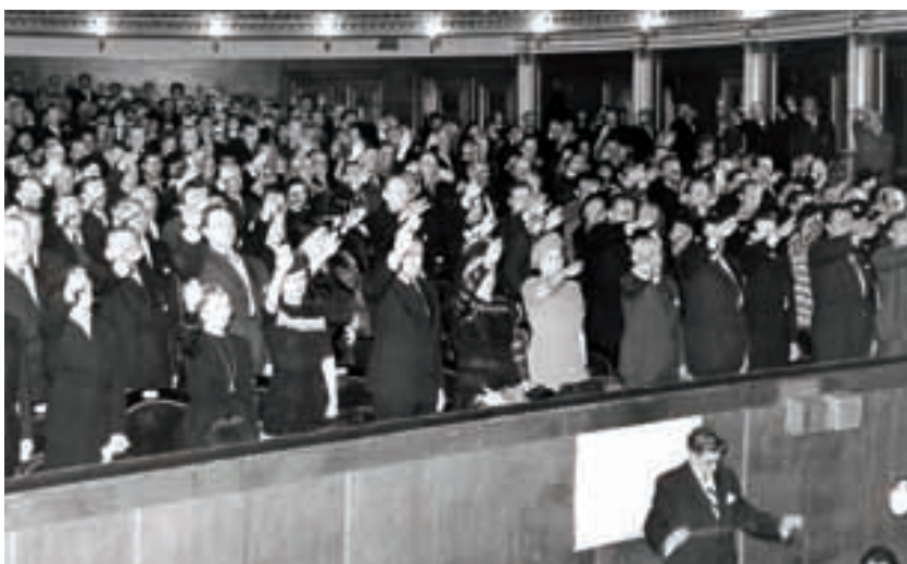
Národní divadlo, 24. června 1942. Apel českých herců a hudebníků v hledišti české první scény. Umělci – svědomí a zrcadlo charakteru národa. Herci zvučných jmen a jejich ruce vylétnuvší vstříc nacistickému pozdravu.