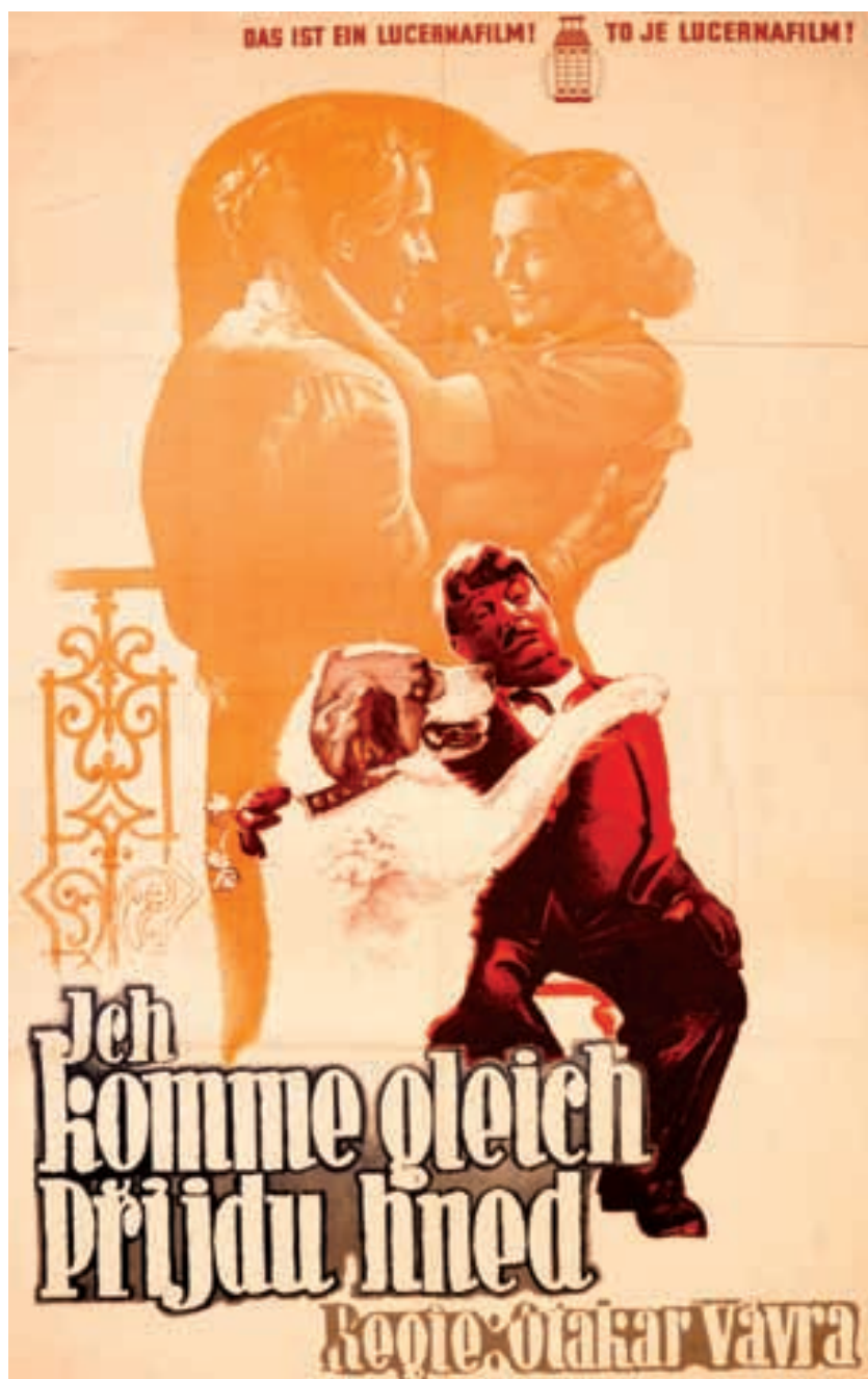
Plakát k filmu Otakara Vávry Přijdu hned