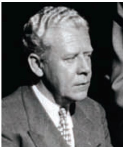
Filmový producent Miloš Havel