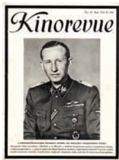
Titulní strana Kinorevue z června 1942