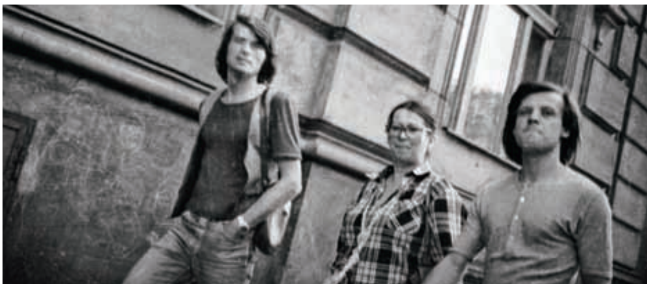
Akce STROJNÍK-1 (Zdena Tominová), 30. 5. 1979, snad ulice Polská, pravděpodobně se svými syny