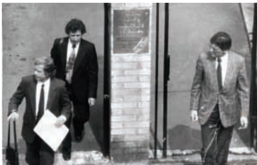
Ivan Havel s bratrem Václavem vycházejí ze zastupitelského úřadu Kanady, datum neurčeno