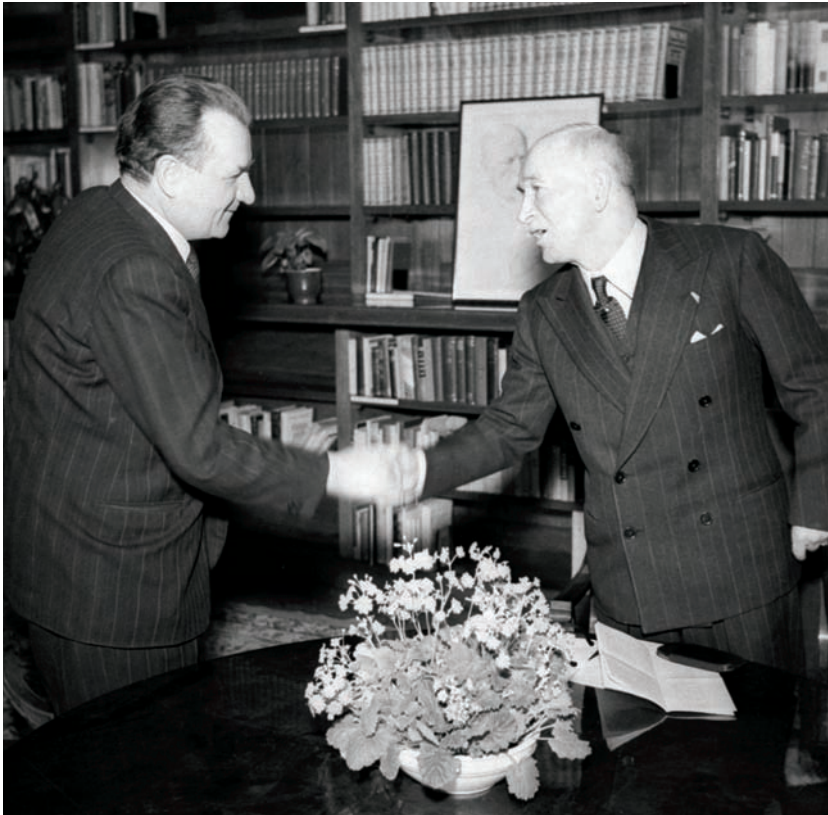
Edvard Beneš přijímá 25. února 1948 Klementa Gottwalda