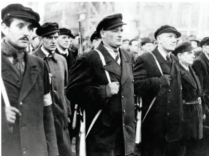
Lidové milice, spíše než „ozbrojená pěst pracujícího lidu“ lůza s ostrými náboji