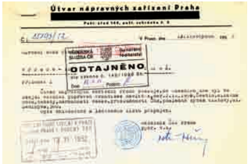
Úřední oznámení o popravě Františka Havlíčka