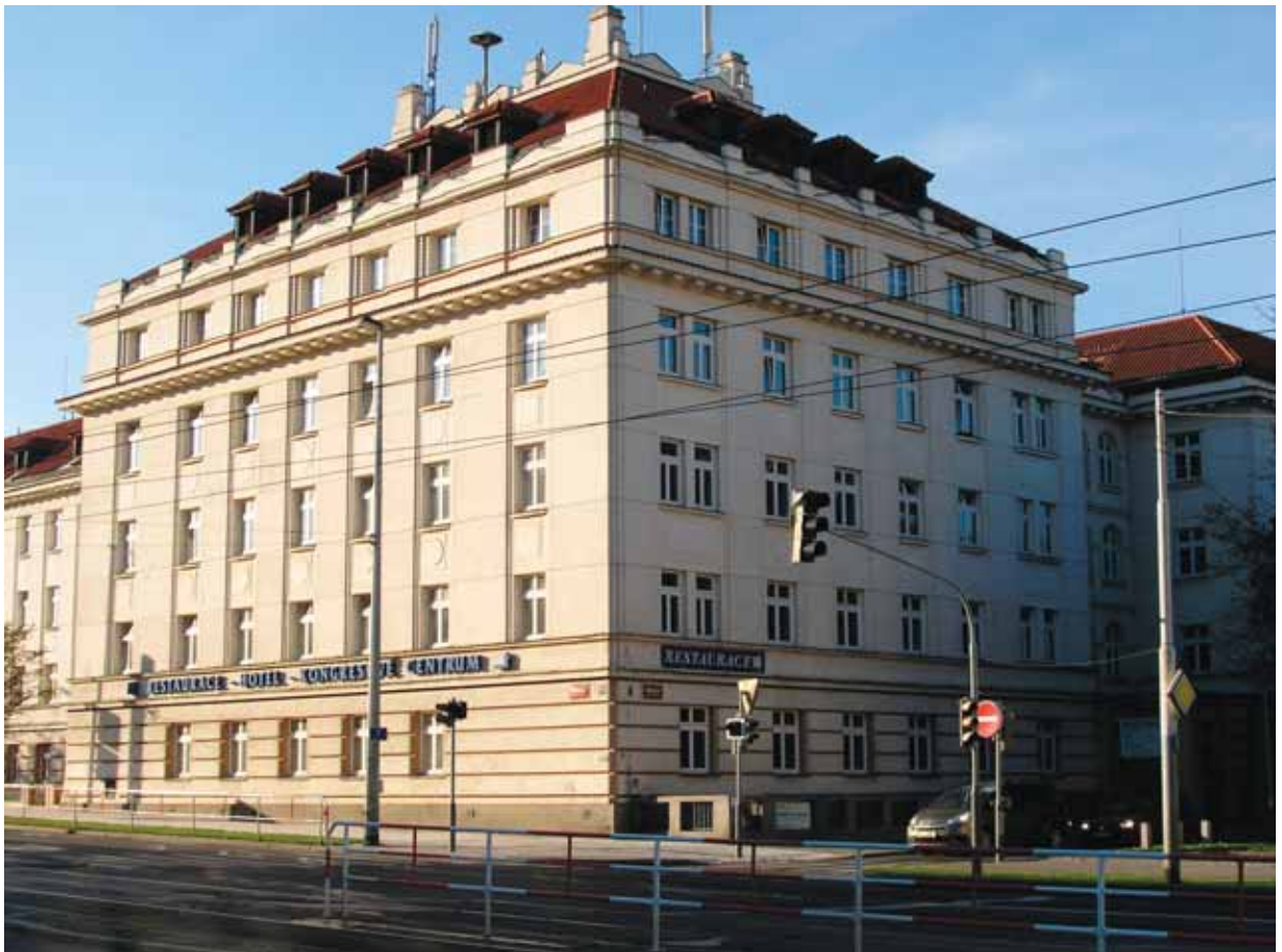
Budova Masarykových kolejí v pražských Dejvicích, ve které sídlila v 80. letech Hlavní správa kontrarozvědky StB, měla pohnutý osud již v období nacistické okupace. V rámci zásahu proti českým vysokoškolským studentům byla tato kolej 17. listopadu 1939 obsazena nacisty a její tehdejší obyvatelé byli transportováni do koncentračního tábora Sachsenhausen. Budova pak do konce války sloužila jako kasárna pro příslušníky jednotek SS.

využití prostředků zpravodajské práce koordinované s postupem dalších článků politického systému na jejich předcházení a eliminaci. [...] Sledovat a analyzovat vznikající nové společenské jevy, prognózovat jejich vývoj a vliv na státobezpečnostní situaci ve státě a tím za dodržení zásady včasné a objektivní informovanosti stranických, státních, hospodářských a dalších společenských orgánů vytvářet základní předpoklad pro efektivní ochranu politiky sociálního a ekonomického rozvoje společnosti a státu. 3